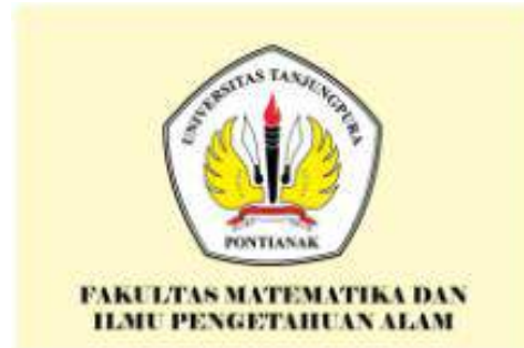
Fakultas Matematika dan Ilmu Pengetahuan Alam (bendera warna kuning muda dengan kode warna RGB = 255, 250, 205)